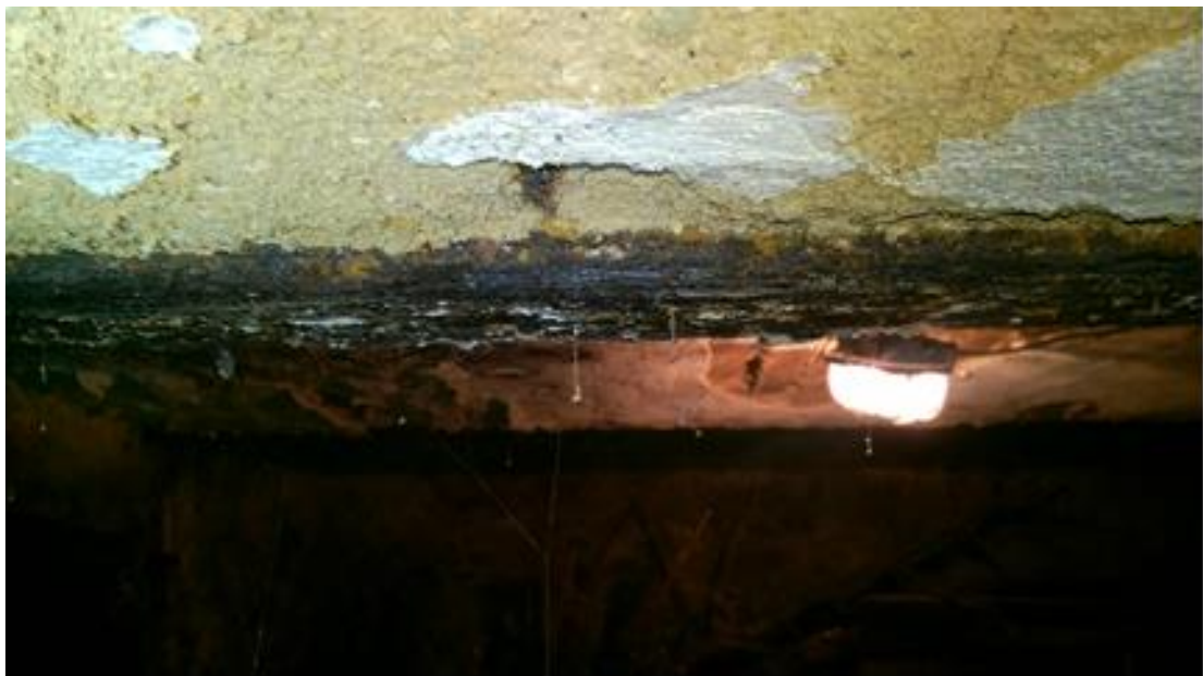
fot. nr 2 korozja ogólna belki stropowej – belka w prawej piwnicy front

Silnie skorodowana belka stropowa. Brak ubytki tynku na ceramicznej płycie łukowej stropu oraz na belce stalowej doprowadziło do korozji wgłębnej. Taki rodzaj korozji powoduje całkowite zniszczenie elementu belki.