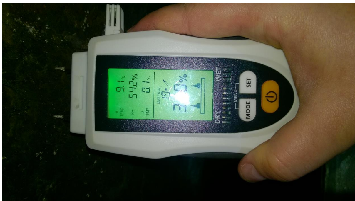
znaczne zawilgocenie ścian zewnętrznych piwnicy

Pomierzono zawilgocenie ścian w pomieszczeniu piwnicznym. Wilgoć w ścianach pomierzono wilgotnościomierzem. Zastosowano wilgotnościomierz LaserLiner MultiWet-Master. Pomiar ściany zewnętrznej (A) przy posadzce ( 20cm nad posadzką) wykazał zawilgocenie od 14,2% do 24,5%. Pomiar w tym obszarze na wysokości 100 cm nad posadzką wykazał zawilgocenie od 18,5% do 26,0%. Pomiar zawilgocenia w punkcie pomiarowym (B) na wysokości 100cm nad poziomem posadzki wykazał zawilgocenie od 14,5% do 37,5%. Wilgotność względna w piwnicy 59,6%, temperatura powietrza 7,4°C, temperatura punktu rosy -0,2°C.