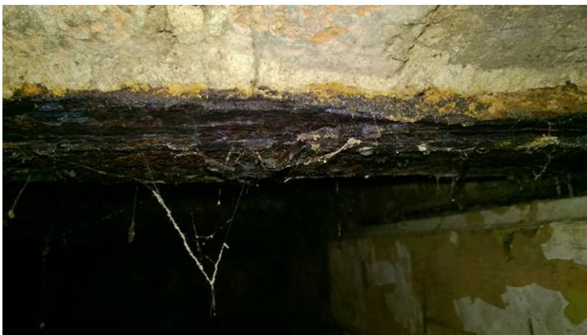
fot. nr 3 skorodowana belka stropowa w skrajnym lewym pomieszczeniu piwnicznym

Tworzące się produkty korozji są słabo związane z podłożem i ze względu na dużą porowatość nie stanowią bariery ochronnej zapobiegającej dalszemu utlenianiu.