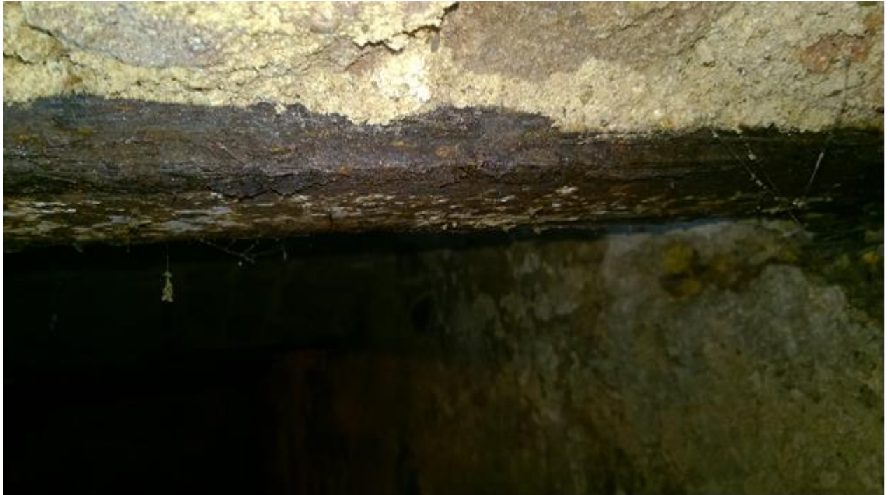
fot. nr 1 korozja powodująca rozwarstwienie dolnych pólek belek stropowych -belka skrajnej prawej piwnicy

Zwiększony poziom wilgoci w części piwnic przyległych do ściany podłużnej zewnętrznej spowodował korozję elementów stalowych stropów piwnic.