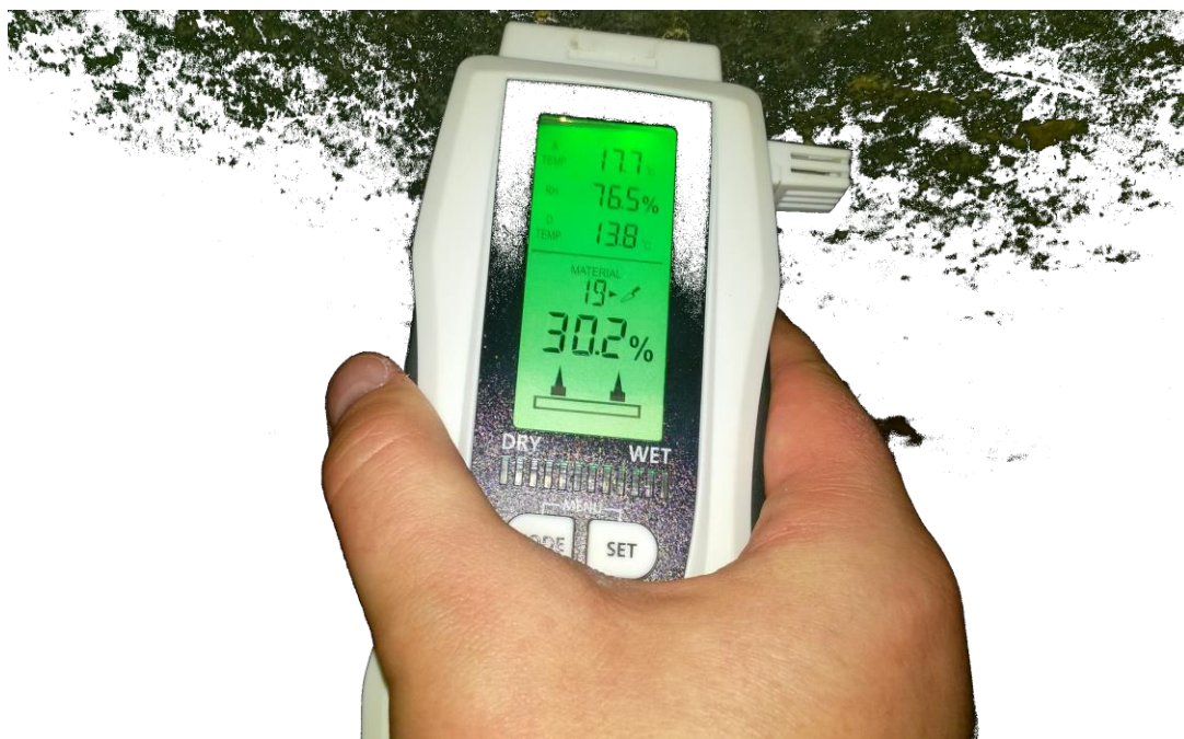
pomiar zawilgocenia w punkcie pomiarowym W2

Pomiar ściany (W2) przy posadzce (20cm nad posadzką) wykazał zawilgocenie od 20,5% do 4027,4%. Pomiar na ścianie (W2) 100cm nad posadzką od 24,4% do 30,2%. Wilgotność względna w tym pomieszczeniu piwnicy 76,5%, temperatura powietrza 17,7°C, temperatura punktu rosy 13,8°C.