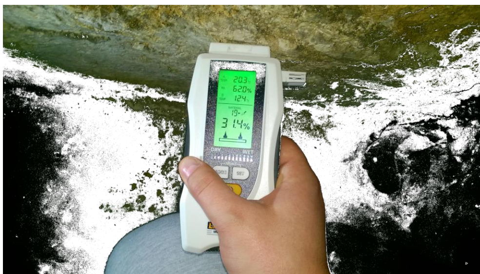
pomiar w punkcie W1

Pomierzono zawilgocenie ścian w pomieszczeniu piwnicznym. Metoda polegała na pomiarzeniu zawilgocenia wilgotnościomierzem. Zastosowano wilgotnościomierz LaserLiner MultiWet-Master. Pomiar ściany (W1) przy posadzce (20cm nad posadzką) wykazał zawilgocenie od 17,7% do 37,6%. Pomiar na ścianie (W1) 100cm nad posadzką od 26,7% do 40,3%. Wilgotność względna w piwnicy 62,0%, temperatura powietrza 20,3°C, temperatura punktu rosy 12,4°C.