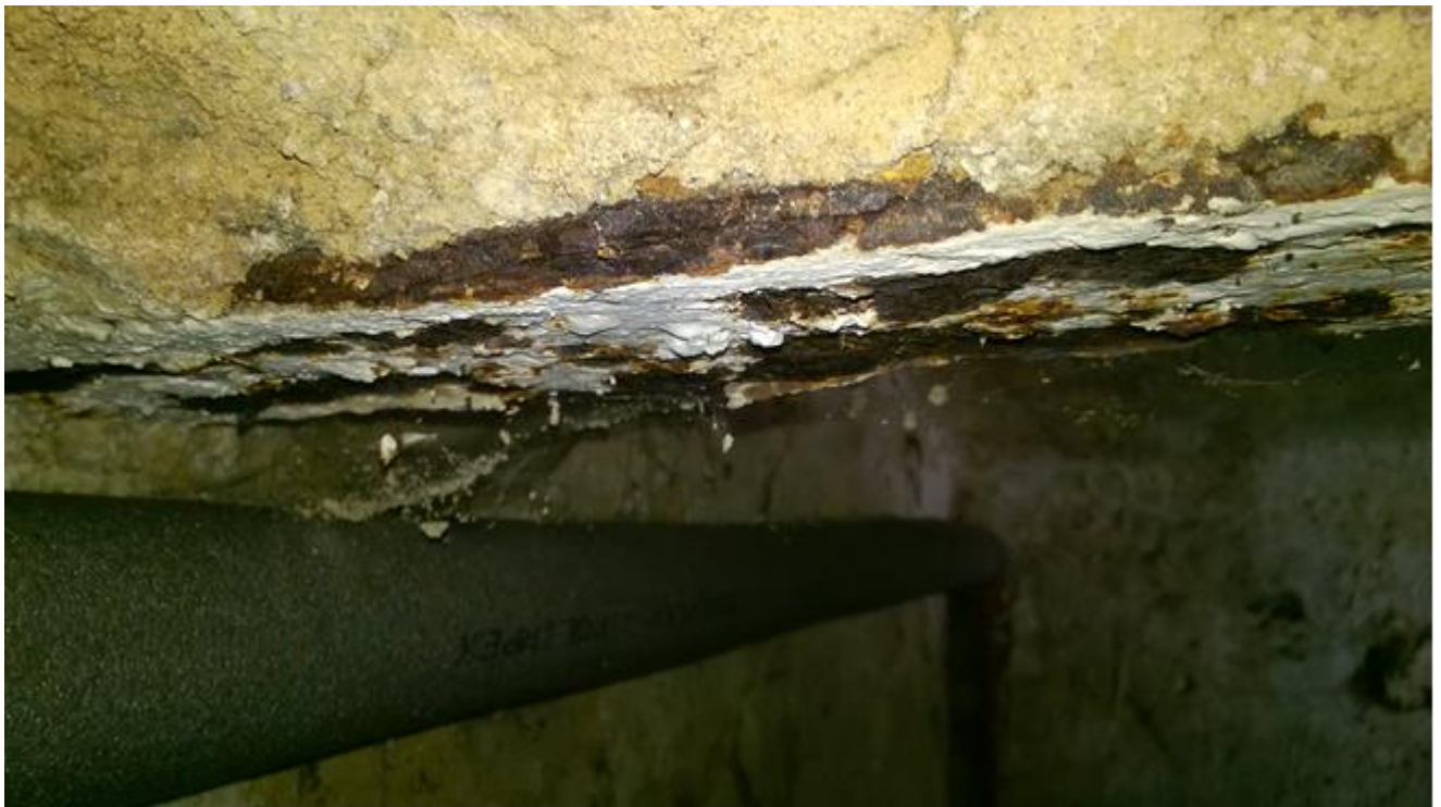
rozwarstwiająca korozja dolnej półki belki stropowej w pomieszczeniu po lewej stronie korytarza piwnicznego

Silnie skorodowana belka stropowa. Znaczne zawilgocenie piwnic doprowadziło do korozji wgłębnej. Taki rodzaj korozji powoduje całkowite zniszczenie elementu belki.