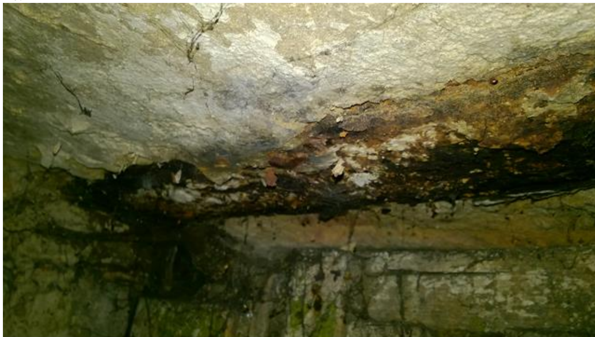
rozwarstwiająca korozja dolnej półki belki stropowej w pomieszczeniu po lewej stronie korytarza piwnicznego

Zwiększony poziom wilgoci w piwnicy spowodował korozję elementów stalowych stropów piwnic.