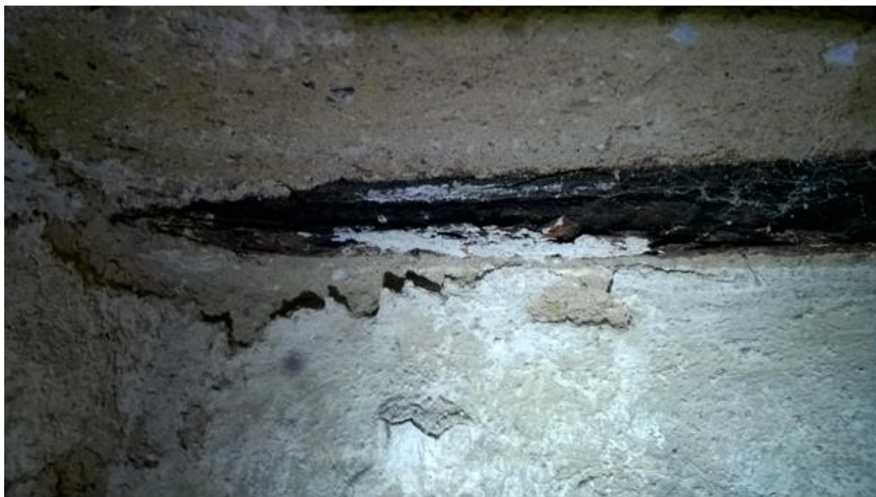
skorodowana belka stropowa w pomieszczeniu piwnicznym przy pralni

Silnie skorodowana belka stropowa. Znaczne zawilgocenie piwnic doprowadziło do korozji wgłębnej. Taki rodzaj korozji powoduje całkowite zniszczenie elementu belki.