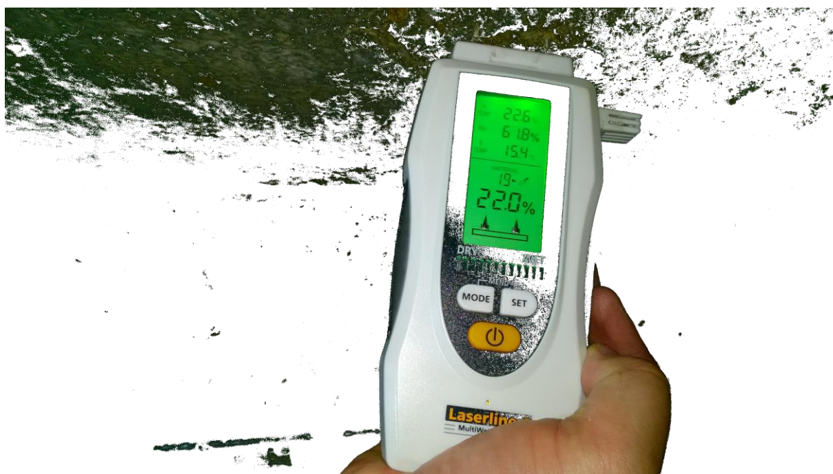
pomiar zawilgocenia ściany piwnic w punkcie pomiarowym W1

Pomierzono zawilgocenie ścian w pomieszczeniu piwnicznym. Metoda polegała na pomiarzeniu zawilgocenia wilgotnościomierzem. Zastosowano wilgotnościomierz Laserliner MultiWet-Master. Pomiar ściany (W1) przy posadzce (20cm nad posadzką) wykazał zawilgocenie od 17,0% do 27,4%. Pomiar na ścianie (W1) 100cm nad posadzką od 14,0% do 24,6%. Wilgotność względna w piwnicy 61,8%, temperatura powietrza 22,6°C, temperatura punktu rosy 15,4°C.