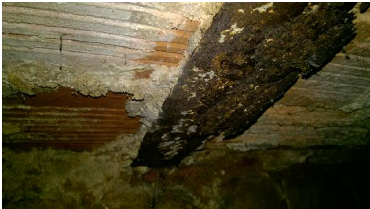
belka we wnęce pod schodami.