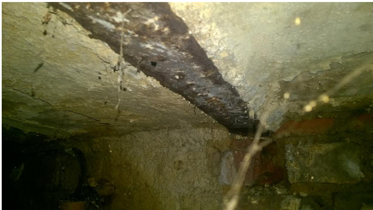
wykute podparcie pod belka stropową

Zwiększony poziom wilgoci w części piwnic przyległych do ściany podłużnej zewnętrznej spowodował korozję elementów stalowych stropów piwnic.