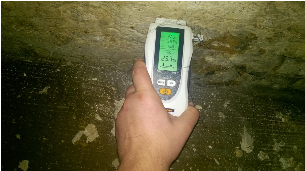
pomiar zawilgocenia w punkcie pomiarowym W1

Pomierzono zawilgocenie ścian w pomieszczeniu piwnicznym. Metoda polegała na pomiarzeniu zawilgocenia wilgotnościomierzem. Zastosowano wilgotnościomierz LaserLiner MultiWet-Master. Pomiar ściany (W1) przy posadzce pomieszczenie nr 10 (20cm nad posadzką) wykazał zawilgocenie od 10,5% do 25,5%. Pomiar na ścianie (W1) 100cm nad posadzką od 22,1% do 25,8%. Wilgotność względna w piwnicy 68,9%, temperatura powietrza 22,6°C, temperatura punktu rosy 16,9°C.