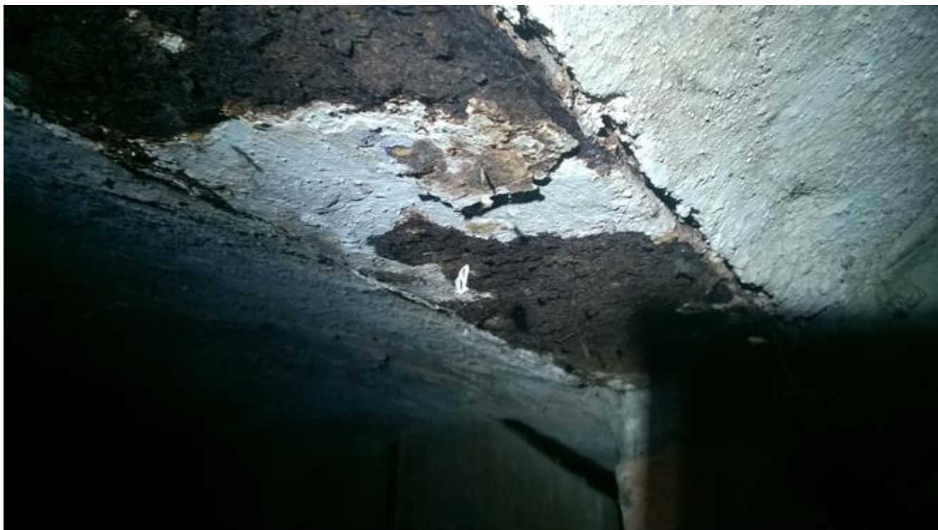
rozwarstwiająca korozja dolnej półki belki stropowej piwnica po lewej stronie korytarza piwnicznego

Zwiększony poziom wilgoci w części piwnic przyległych do ściany podłużnej zewnętrznej spowodował korozję elementów stalowych stropów piwnic.