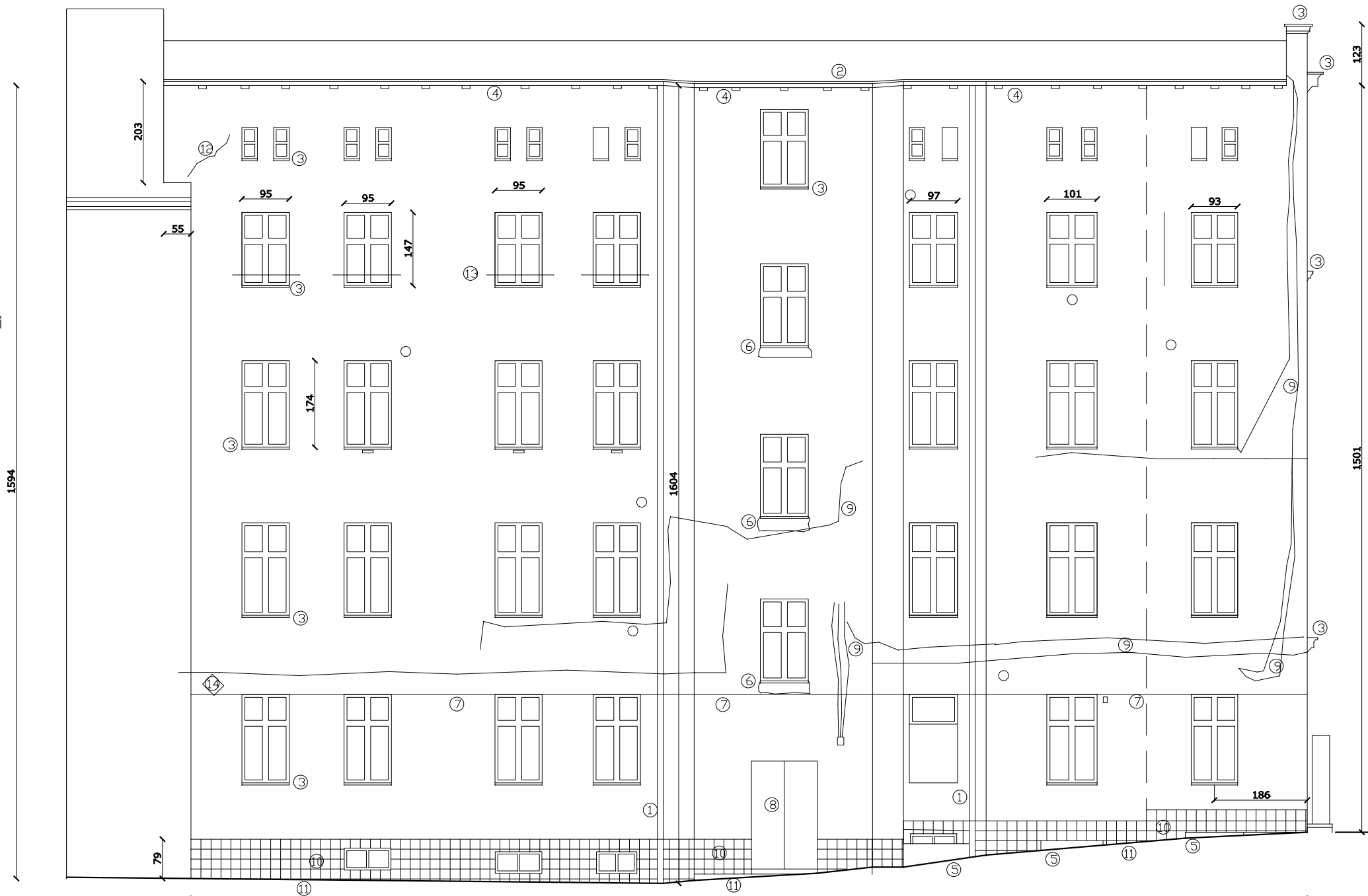
BUD. NR 21 BUDYNEK NR 19 ROZWINIĘCIE ELEWACYJNE WCHODNIE ( PODWÓRZOWE )