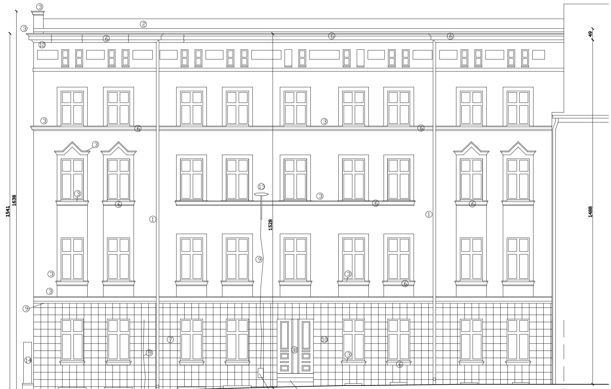
ELEWACJA ZACHODNIA ( FRONTOWA )