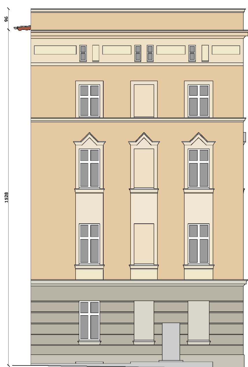
ELEWACJA PÓŁNOCNA ( SZCZYTOWA )