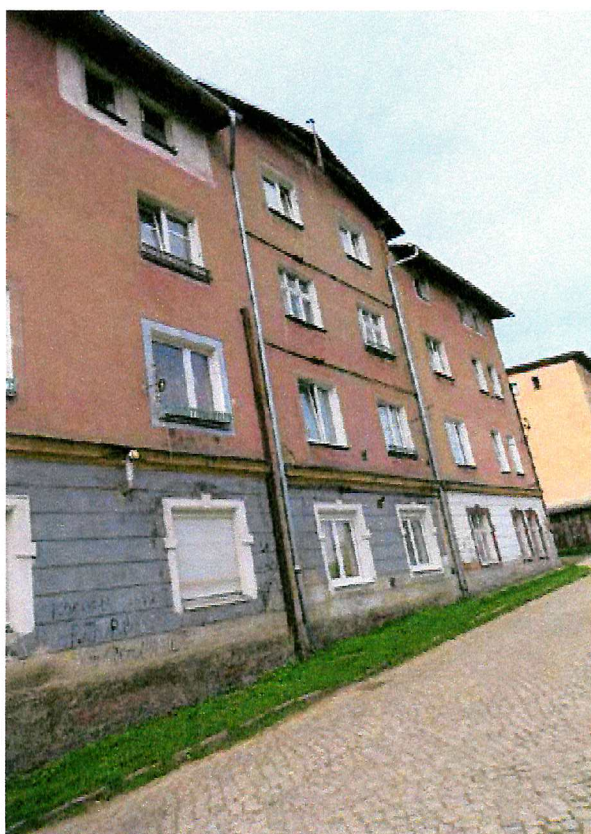
Fot. 3. Ogólny widok elewacji budynku.