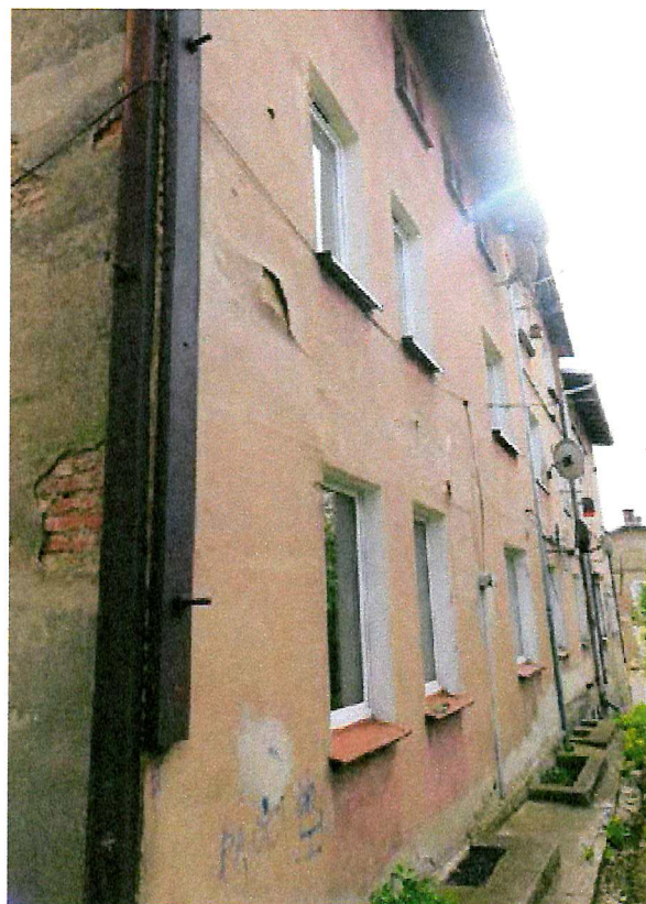
Fot. 5. Ogólny widok elewacji budynku - brak miejsc lęgowych ptaków.