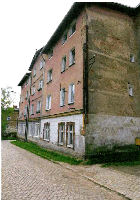
Fot. 2. Ogólny widok elewacji budynku.