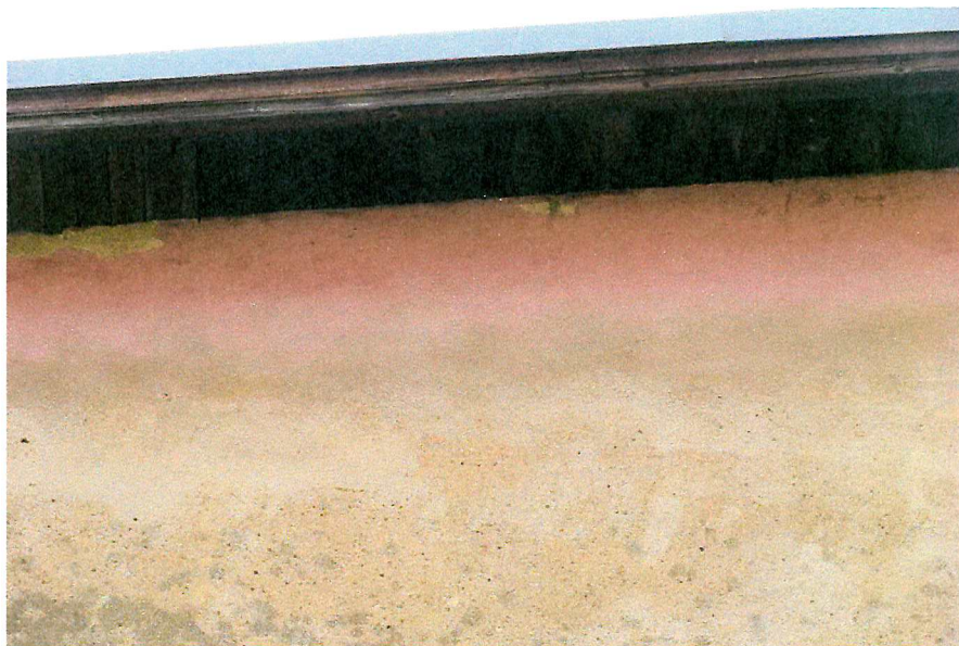
Fot. 6. Zakończenie dachu - brak miejsc lęgowych ptaków.