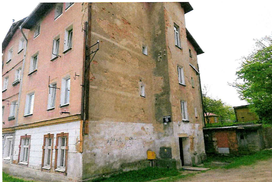
Fot. 1. Ogólny widok budynku.

W czasie badań ww. budynku nie stwierdzono potencjalnych miejsc rozrodczych dla nietoperzy, nie stwierdzono również samych zwierząt.