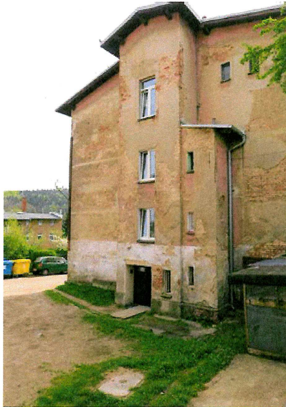
Fot. 4. Ogólny widok elewacji budynku.