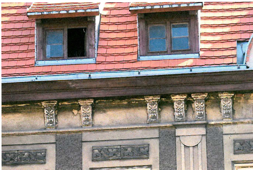
Fot. 6. Zakończenie dachu - brak miejsc lęgowych ptaków.