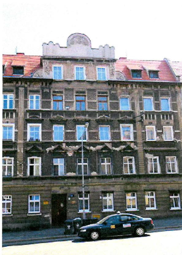
Fot. 5. Ogólny widok elewacji budynku - brak miejsc lęgowych ptaków.