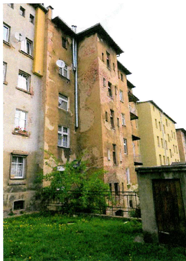
Fot. 3. Ogólny widok elewacji budynku.