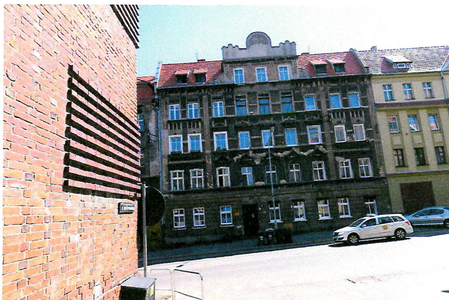
Fot. 1. Ogólny widok budynku.

W czasie badań ww. budynku nie stwierdzono potencjalnych miejsc rozrodczych dla nietoperzy, nie stwierdzono również samych zwierząt.