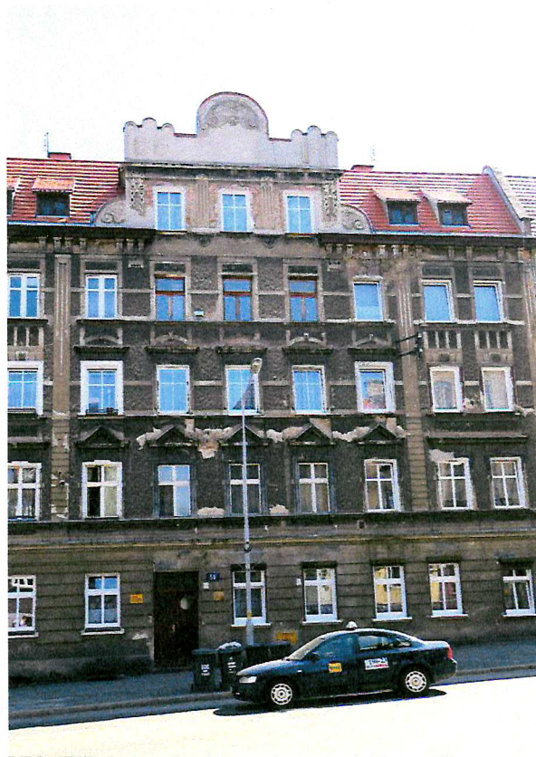
Fot. 2. Ogólny widok elewacji budynku.