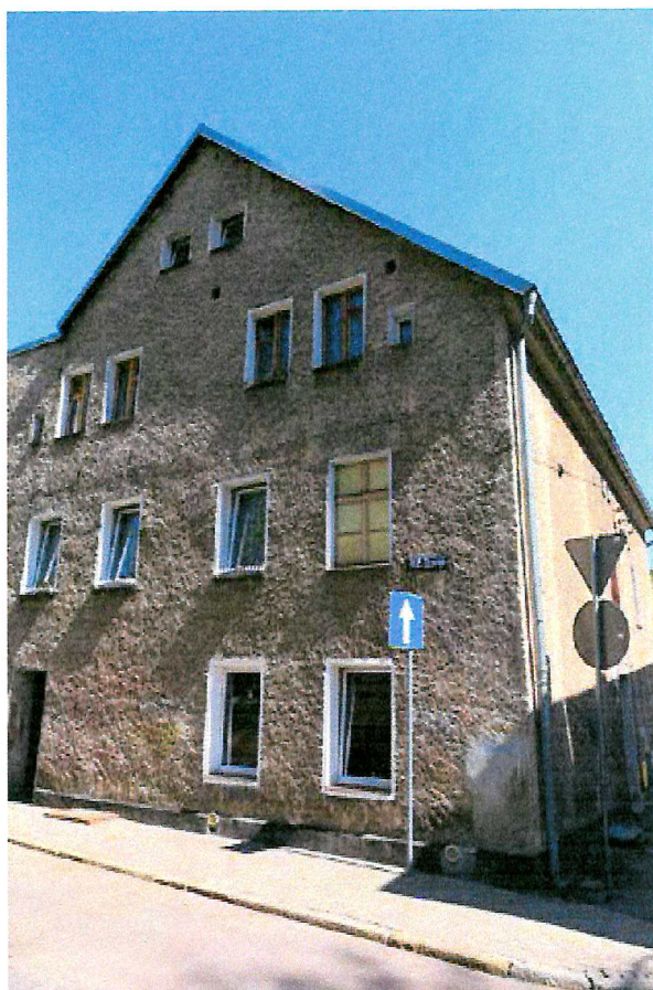
Fot. 2. Ogólny widok elewacji budynku.