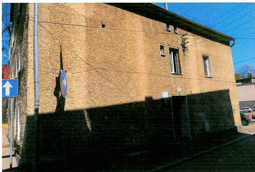
Fot. 3. Ogólny widok elewacji budynku.