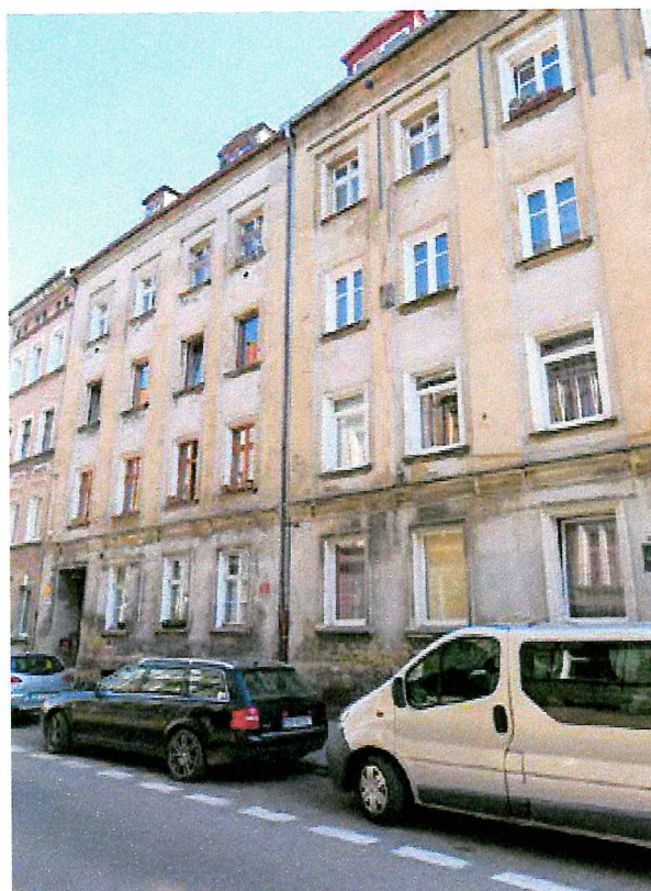
Fot. 2. Ogólny widok elewacji budynku.