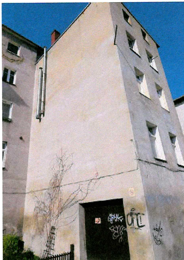
Fot. 3. Ogólny widok elewacji budynku.