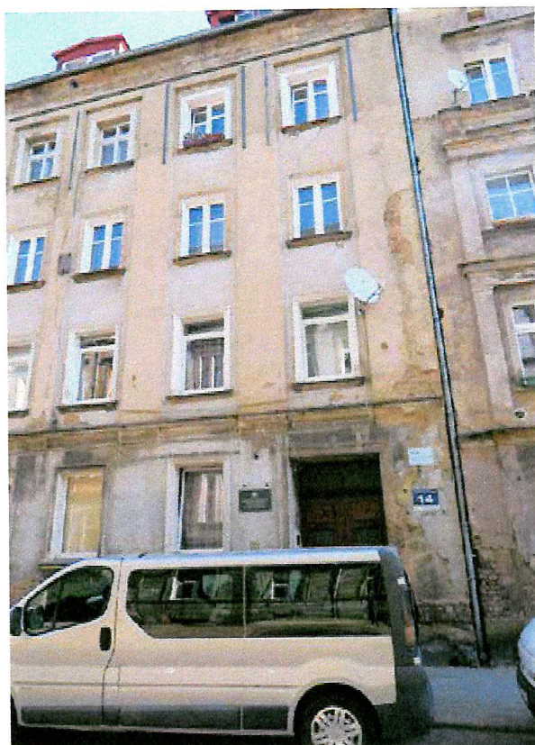
Fot. 1. Ogólny widok budynku.