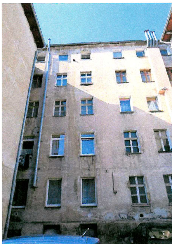
Fot. 4. Ogólny widok elewacji budynku.