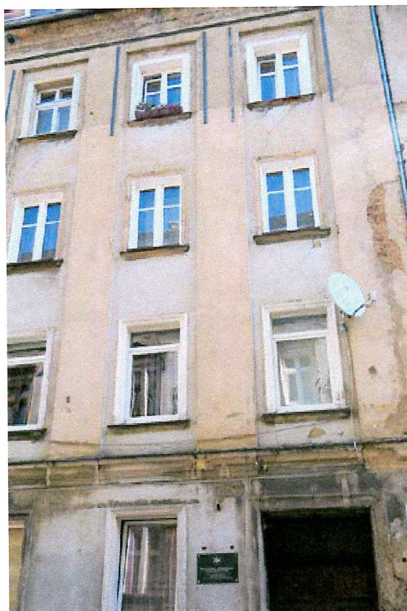
Fot. 5. Ogólny widok elewacji budynku - brak miejsc lęgowych ptaków.