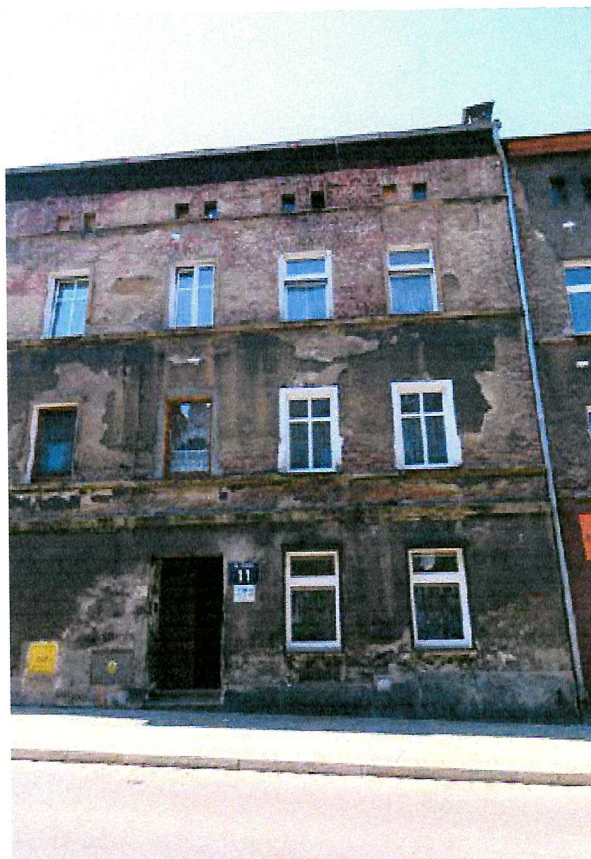
Fot. 2. Ogólny widok elewacji budynku.