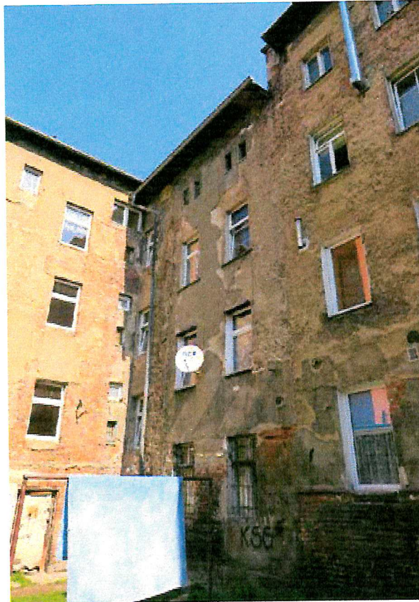
Fot. 4. Ogólny widok elewacji budynku.