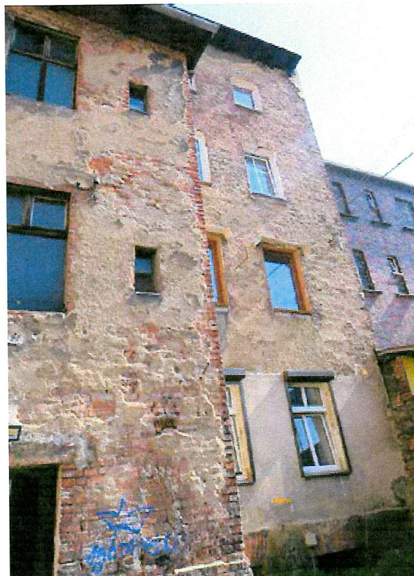
Fot. 5. Ogólny widok elewacji budynku - brak miejsc lęgowych ptaków.