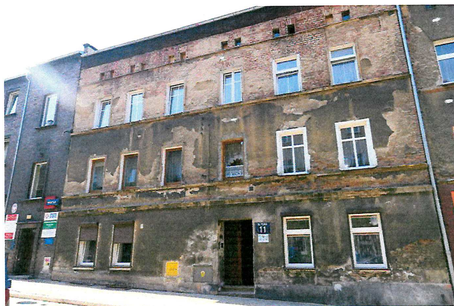
Fot. 1. Ogólny widok budynku.

W czasie badań ww. budynku nie stwierdzono potencjalnych miejsc rozrodczych dla nietoperzy, nie stwierdzono również samych zwierząt.