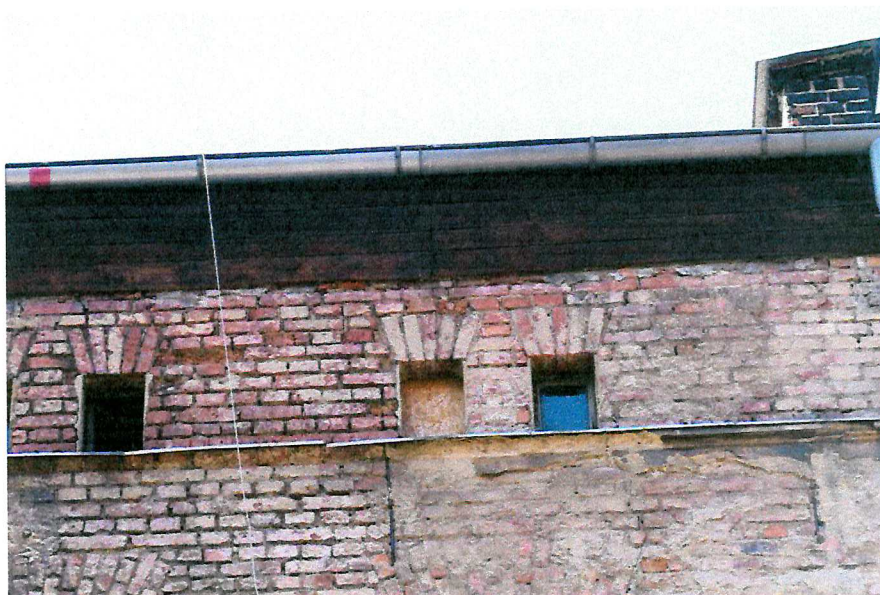
Fot. 6. Zakończenie dachu - brak miejsc lęgowych ptaków.