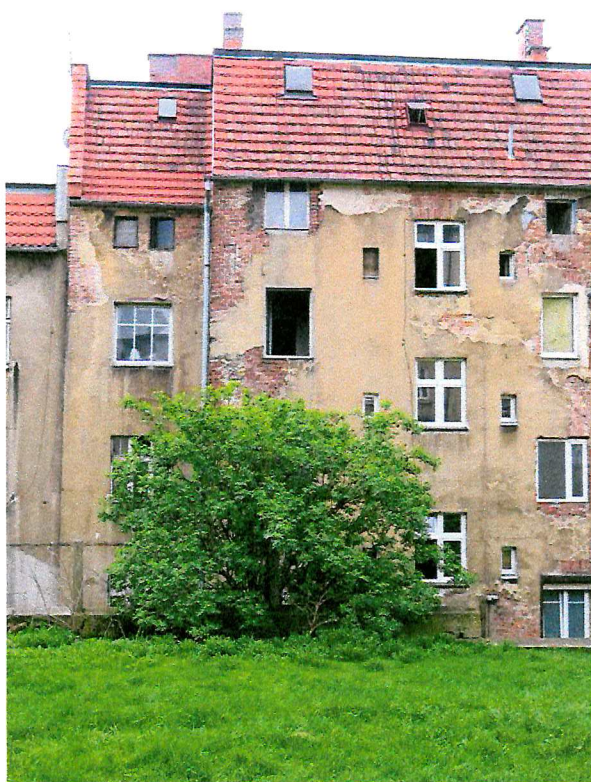
Fot. 4. Ogólny widok elewacji budynku.