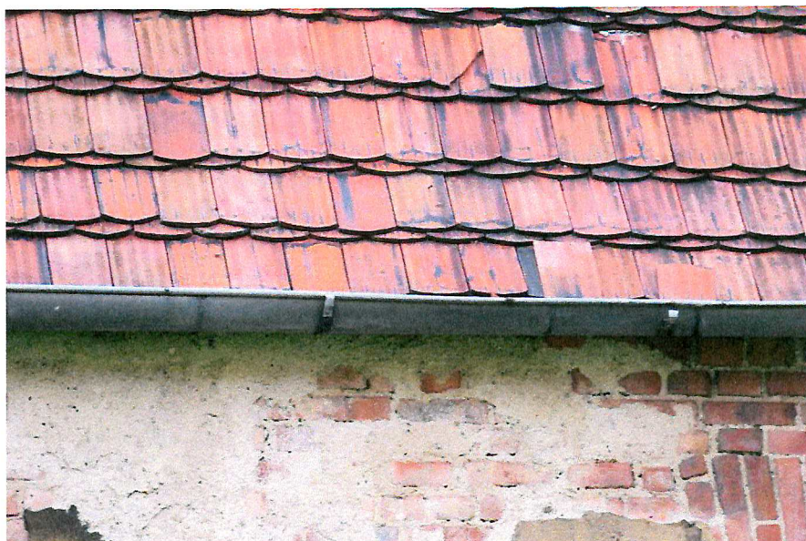
Fot. 6. Zakończenie dachu - brak miejsc lęgowych ptaków.