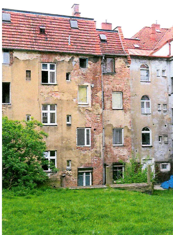
Fot. 5. Ogólny widok elewacji budynku - brak miejsc lęgowych ptaków.