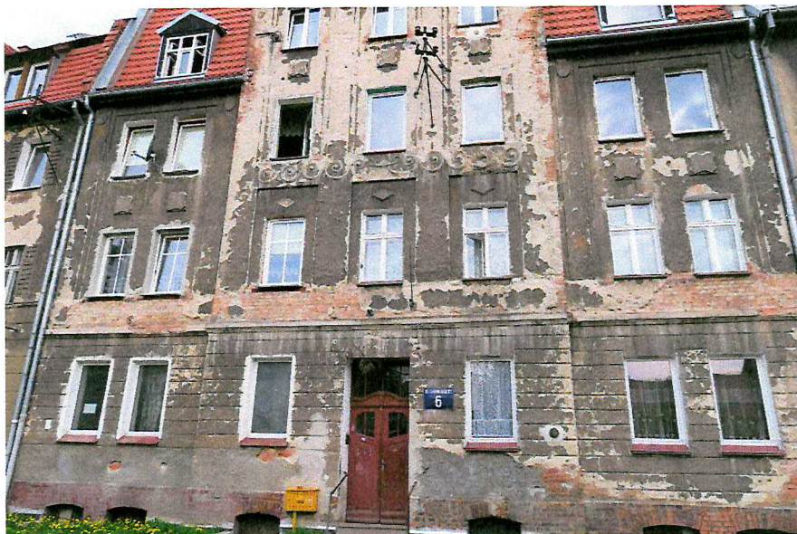
Fot. 1. Ogólny widok budynku.

W czasie badań ww. budynku nie stwierdzono potencjalnych miejsc rozrodczych dla nietoperzy, nie stwierdzono również samych zwierząt.