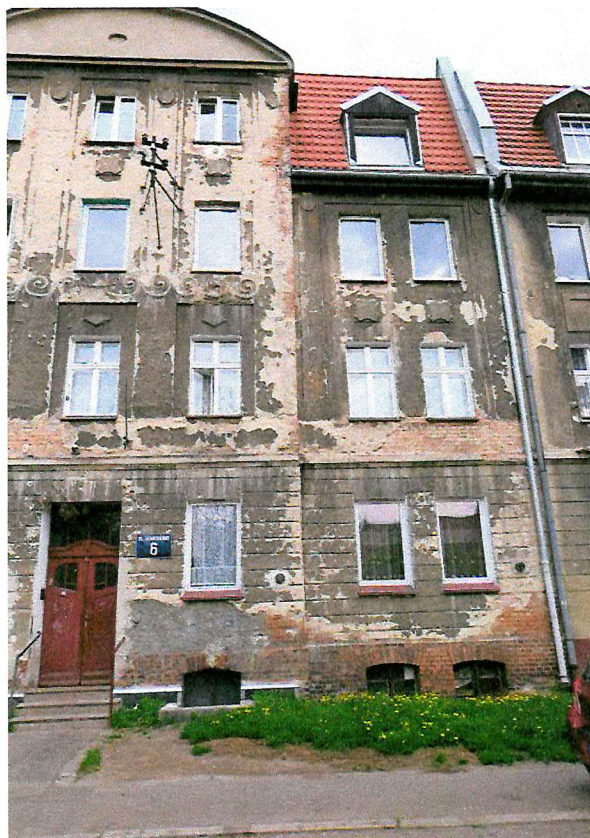
Fot. 3. Ogólny widok elewacji budynku.