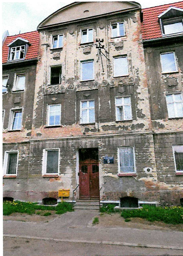
Fot. 2. Ogólny widok elewacji budynku.