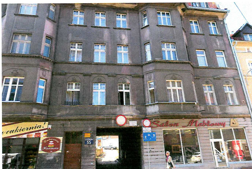
Fot. 1. Ogólny widok budynku.

W czasie badań ww. budynku nie stwierdzono potencjalnych miejsc rozrodczych dla nietoperzy, nie stwierdzono również samych zwierząt.