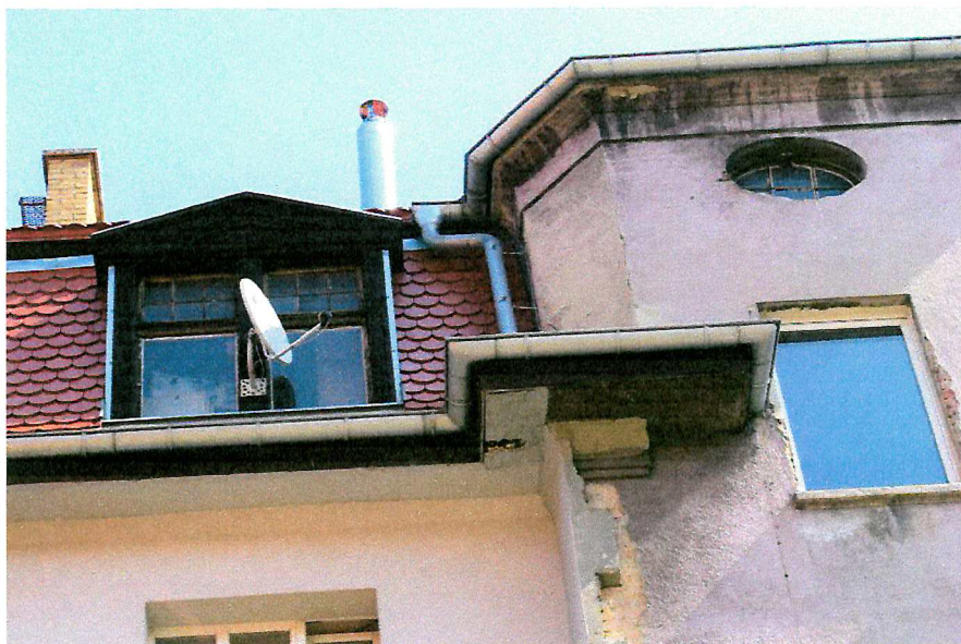
Fot. 6. Zakończenie dachu - brak miejsc lęgowych ptaków.