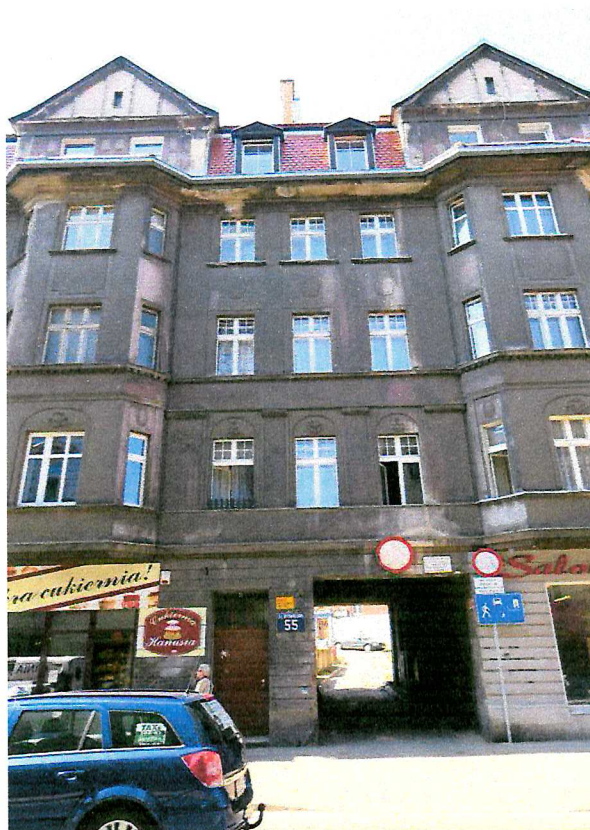
Fot. 2. Ogólny widok elewacji budynku.