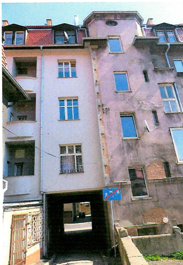
Fot. 4. Ogólny widok elewacji budynku.