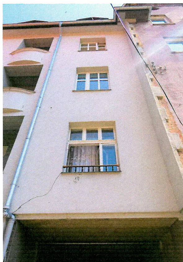
Fot. 3. Ogólny widok elewacji budynku.