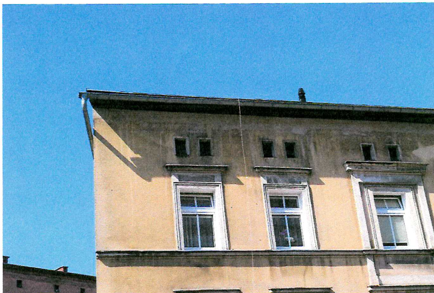
Fot. 6. Zakończenie dachu - brak miejsc lęgowych ptaków.