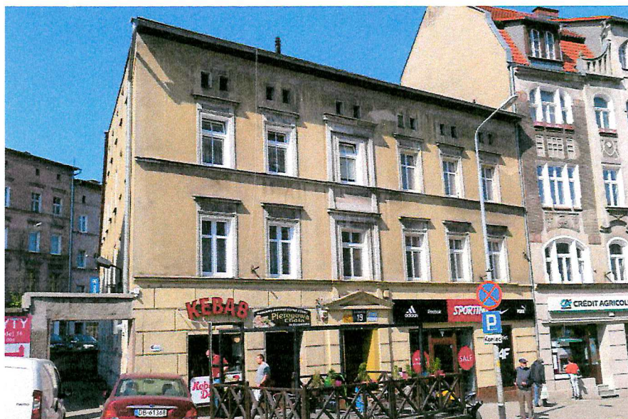
Fot. 1. Ogólny widok budynku.

W czasie badań ww. budynku nie stwierdzono potencjalnych miejsc rozrodczych dla nietoperzy, nie stwierdzono również samych zwierząt.