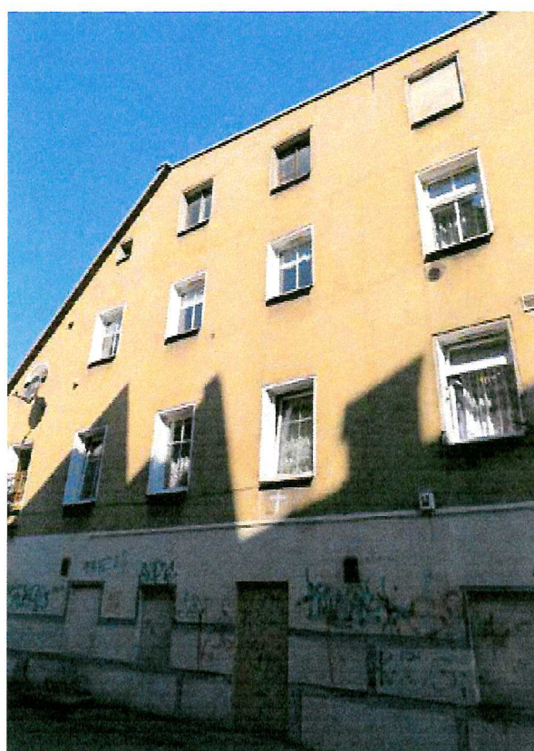
Fot. 3. Ogólny widok elewacji budynku.