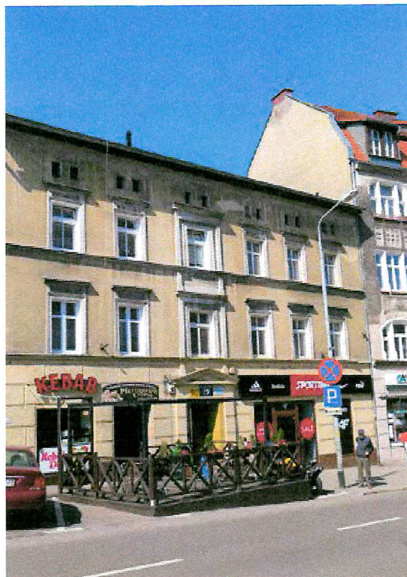
Fot. 2. Ogólny widok elewacji budynku.