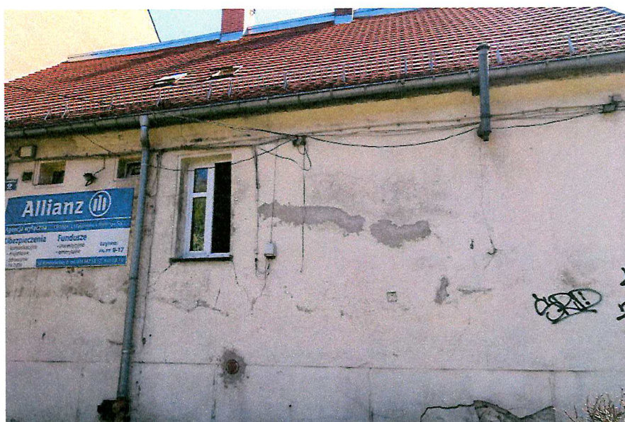
Fot. 5. Ogólny widok elewacji budynku - brak miejsc lęgowych ptaków.