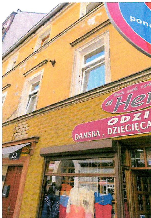
Fot. 4. Ogólny widok elewacji budynku.