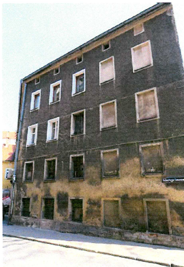
Fot. 2. Ogólny widok elewacji budynku.