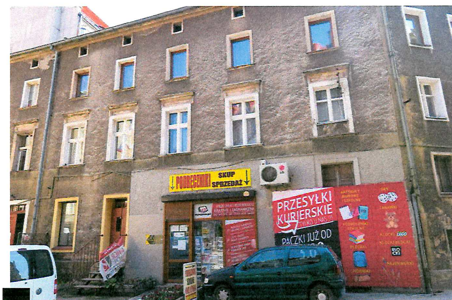
Fot. 1. Ogólny widok budynku.

W czasie badań ww. budynku nie stwierdzono potencjalnych miejsc rozrodczych dla nietoperzy, nie stwierdzono również samych zwierząt.