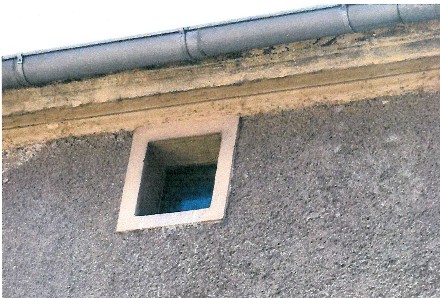
Fot. 6. Zakończenie dachu - brak miejsc lęgowych ptaków.