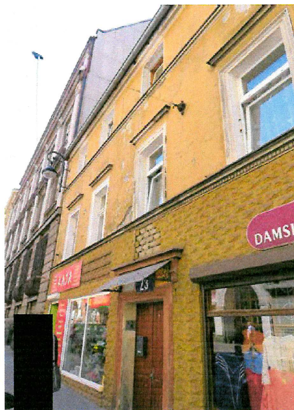
Fot. 3. Ogólny widok elewacji budynku.