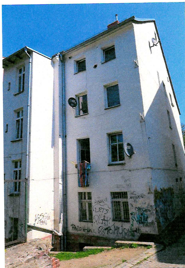
Fot. 4. Ogólny widok elewacji budynku.