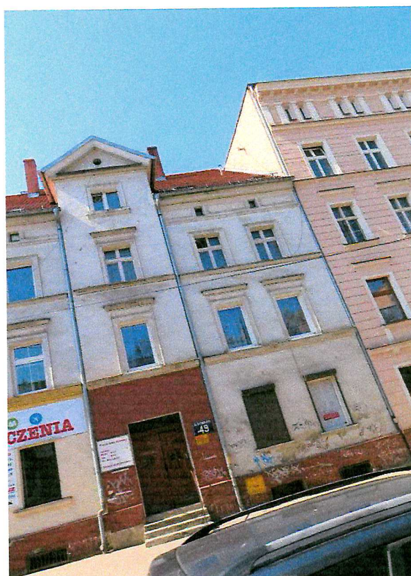
Fot. 3. Ogólny widok elewacji budynku.