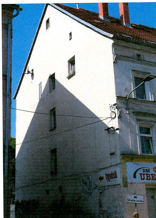
Fot. 5. Ogólny widok elewacji budynku - brak miejsc lęgowych ptaków.