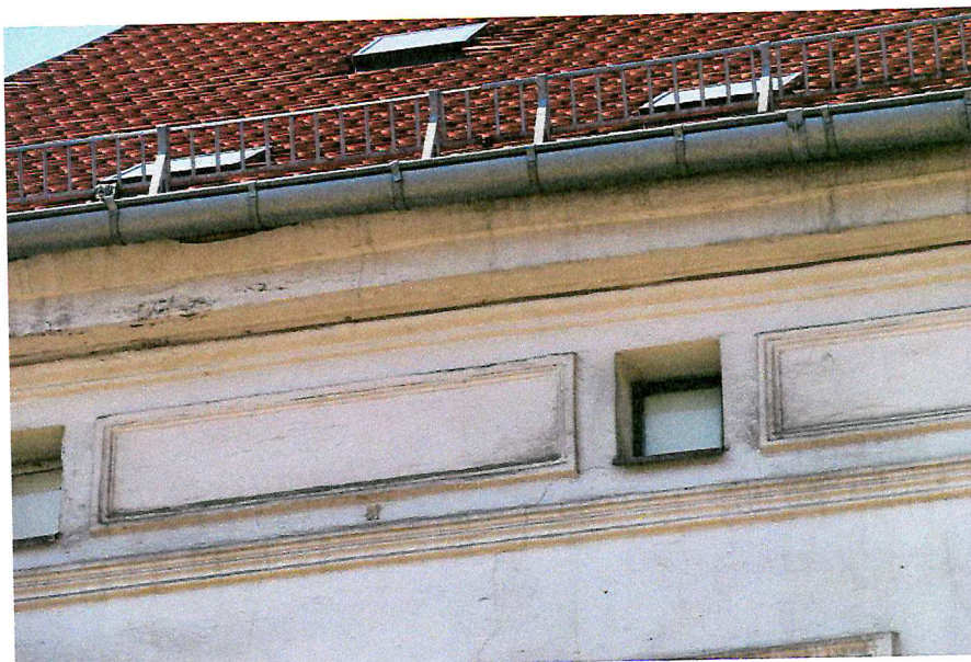
Fot. 6. Zakończenie dachu - brak miejsc lęgowych ptaków.