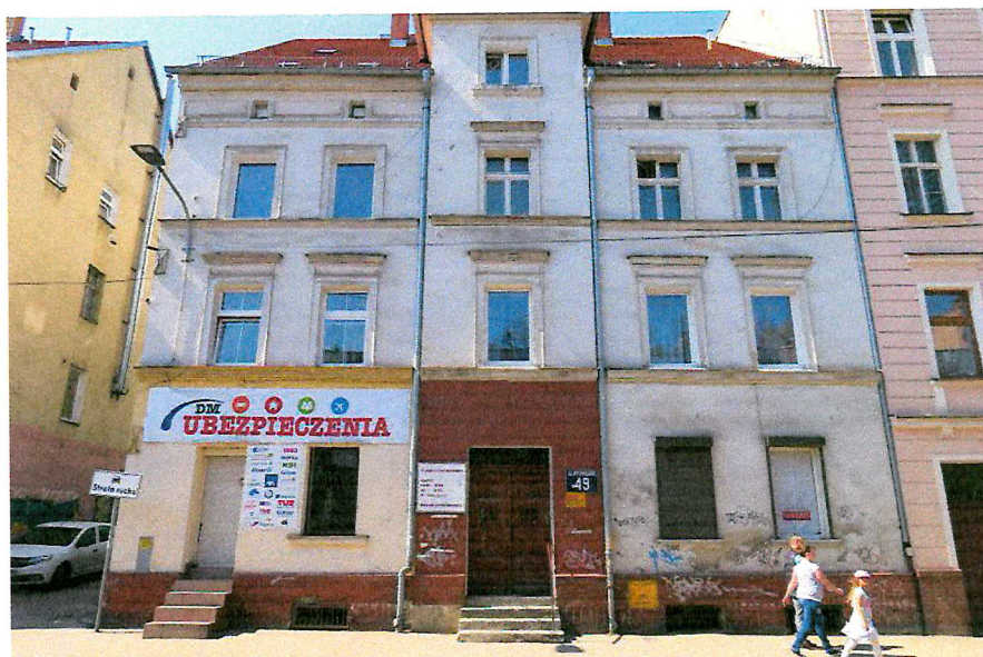
Fot. 1. Ogólny widok budynku.

W czasie badań ww. budynku nie stwierdzono potencjalnych miejsc rozrodczych dla nietoperzy, nie stwierdzono również samych zwierząt.