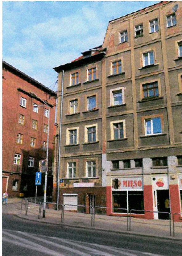
Fot. 2. Ogólny widok elewacji budynku.