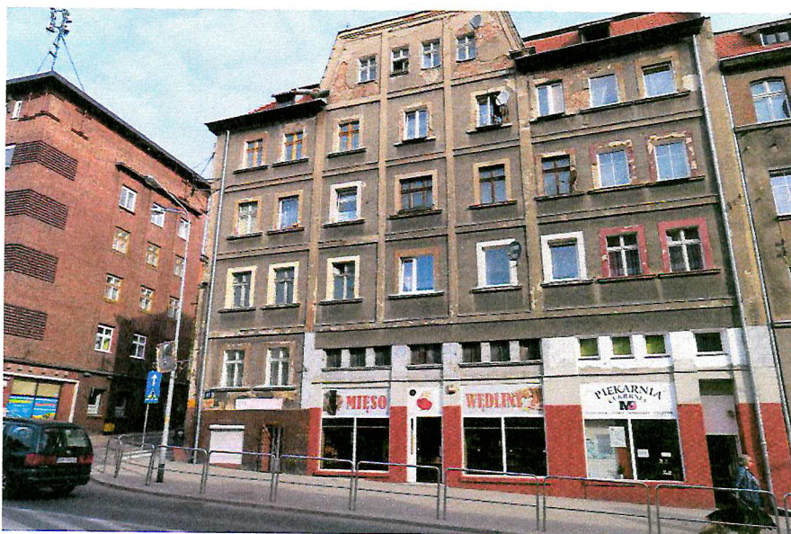
Fot. 1. Ogólny widok budynku.

W czasie badań ww. budynku nie stwierdzono potencjalnych miejsc rozrodczych dla nietoperzy, nie stwierdzono również samych zwierząt.