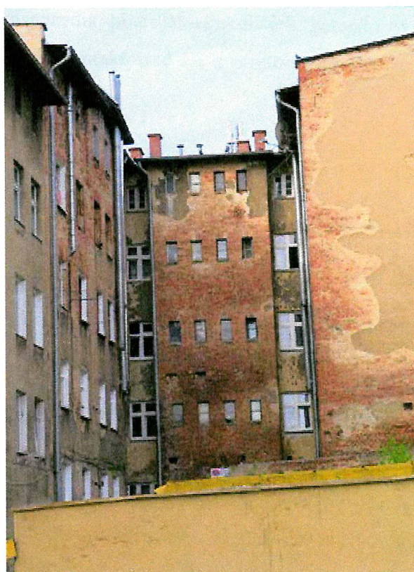
Fot. 5. Ogólny widok elewacji budynku - brak miejsc lęgowych ptaków.