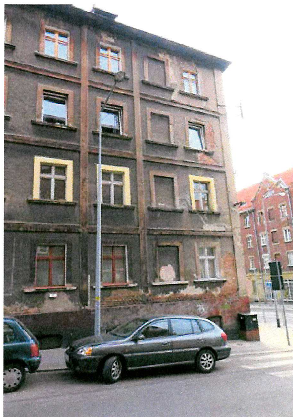
Fot. 3. Ogólny widok elewacji budynku.