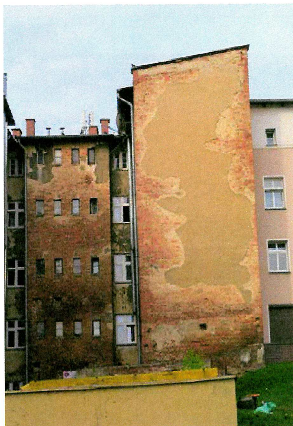
Fot. 4. Ogólny widok elewacji budynku.