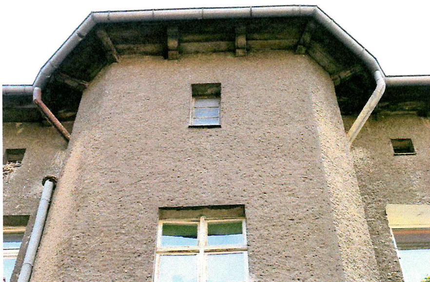
Fot. 4. Ogólny widok elewacji budynku - brak miejsc lęgowych ptaków.