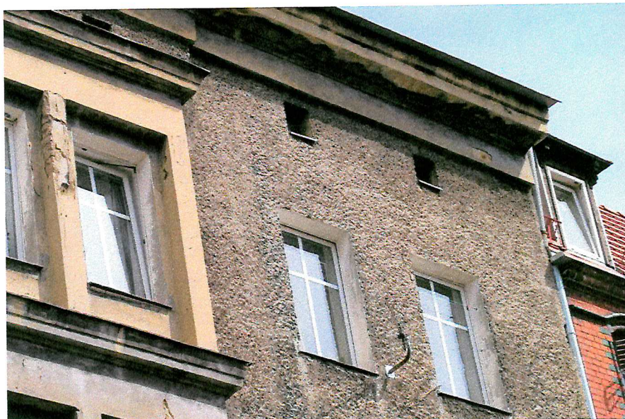
Fot. 5. Ogólny widok elewacji budynku.