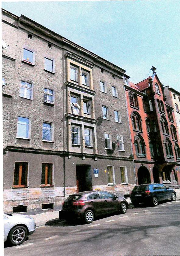
Fot. 1. Ogólny widok budynku.