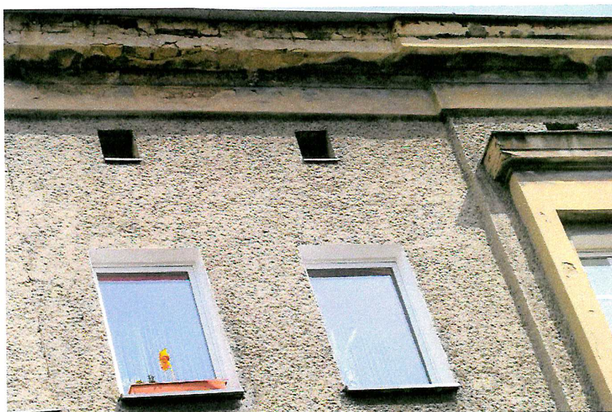
Fot. 6. Zakończenie dachu - brak miejsc lęgowych ptaków.