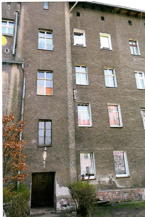
Fot. 3. Ogólny widok elewacji budynku.