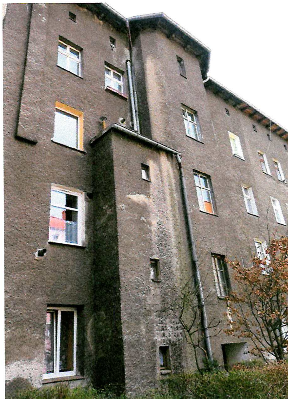
Fot. 2. Ogólny widok elewacji budynku.