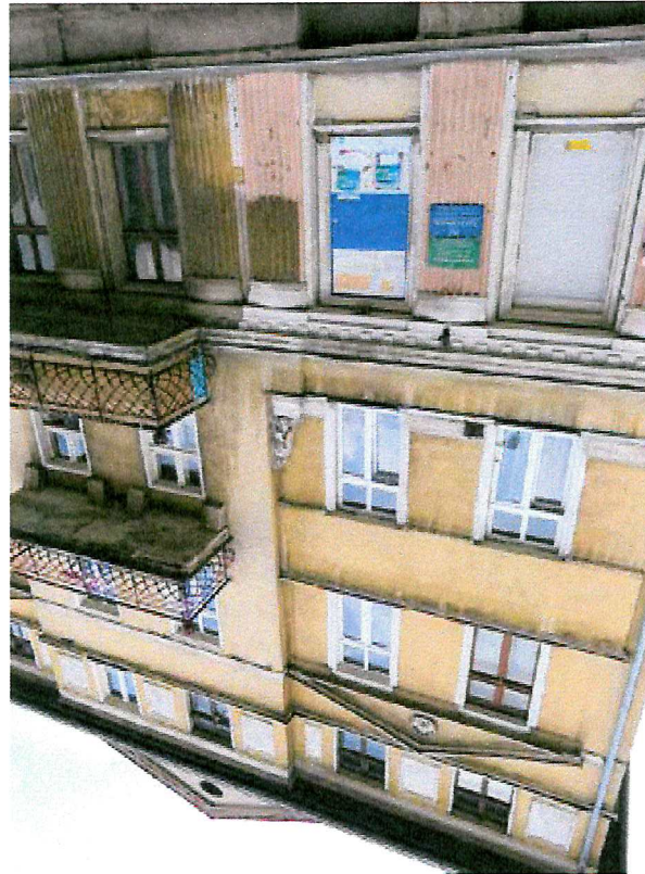
Fot. 2. Ogólny widok elewacji budynku.