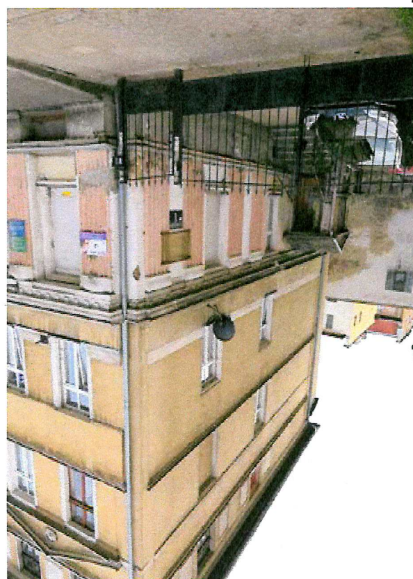
Fot. 1. Ogólny widok budynku.