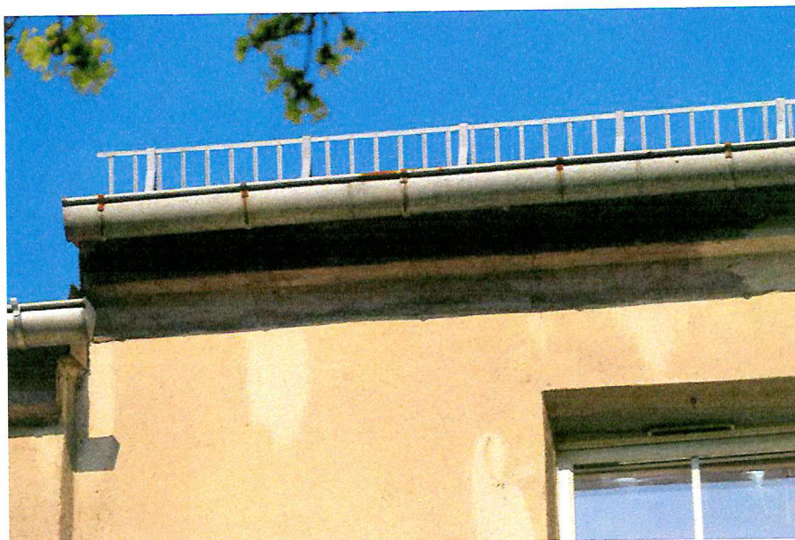
Fot. 6. Zakończenie dachu - brak miejsc lęgowych ptaków.