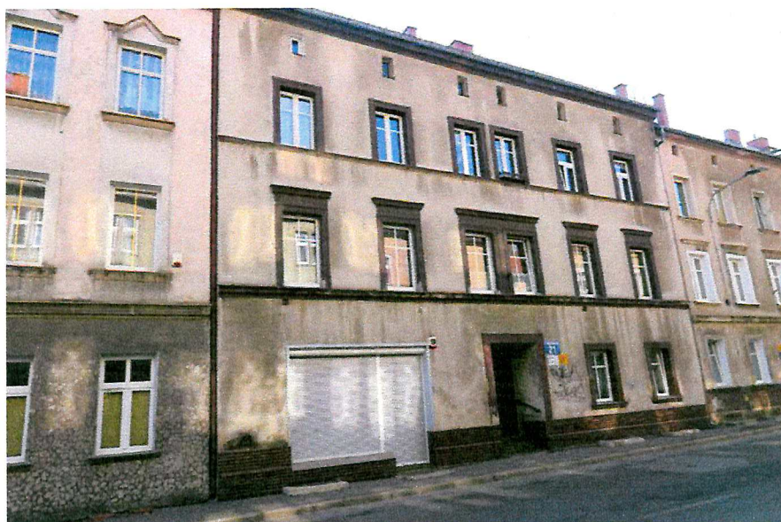
Fot. 1. Ogólny widok budynku.

W czasie badań ww. budynku nie stwierdzono potencjalnych miejsc rozrodczych dla nietoperzy, nie stwierdzono również samych zwierząt.