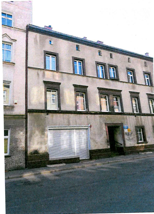
Fot. 2. Ogólny widok elewacji budynku.