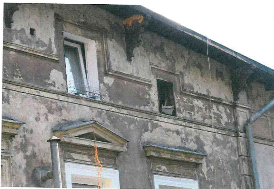
Fot. 4. Ogólny widok elewacji budynku.