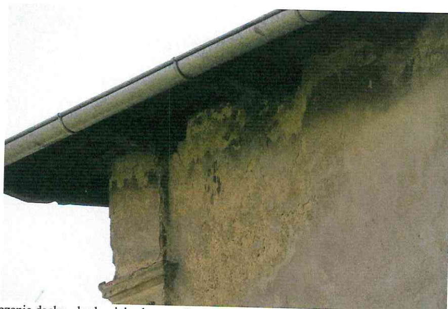
Fot. 6. Zakończenie dachu - brak miejsc lęgowych ptaków.