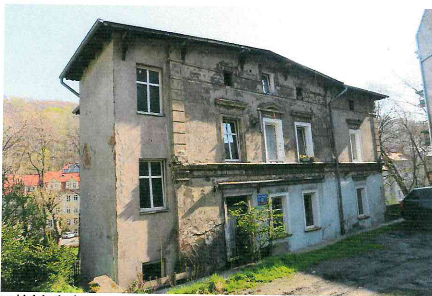
Fot. 1. Ogólny widok budynku.

W czasie badań ww. budynku nie stwierdzono potencjalnych miejsc rozrodczych dla nietoperzy, nie stwierdzono również samych zwierząt.