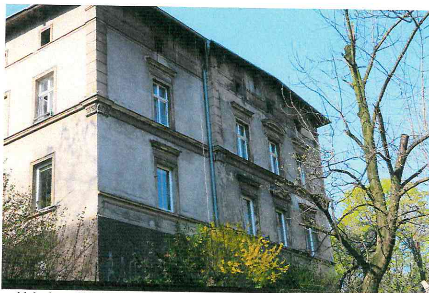
Fot. 5. Ogólny widok elewacji budynku - brak miejsc lęgowych ptaków.