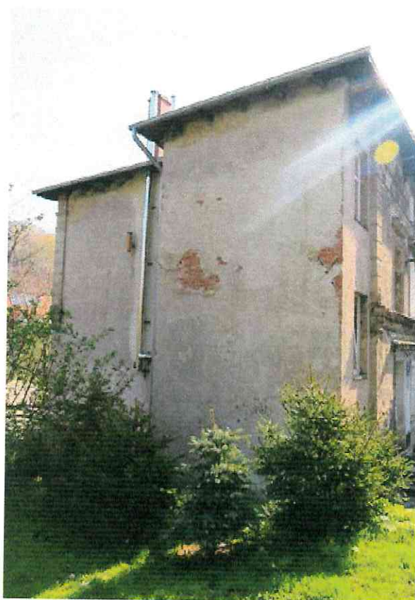
Fot. 2. Ogólny widok elewacji budynku.