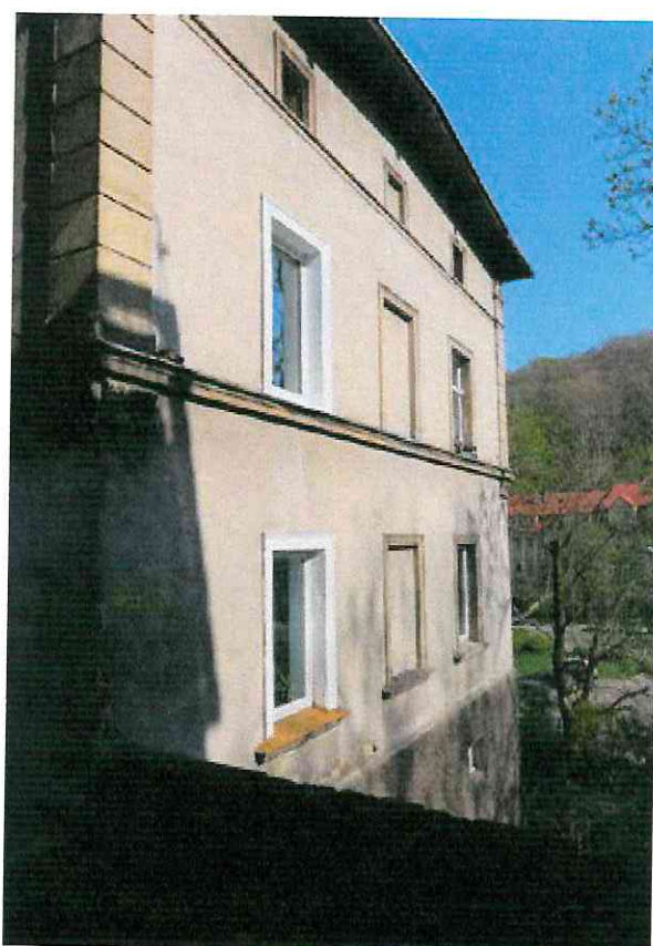
Fot. 3. Ogólny widok elewacji budynku.