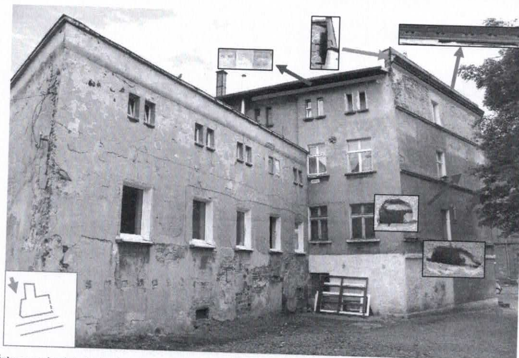
Fot. 2. Ściana zachodnia budynku przy ul. 1 Maja 110 w Wałbrzychu – ściana 2. Linia fioletową zaznaczono potencjalne miejsca gniazdowania jerzyków oraz potencjalne schronienia nietoperzy. Linia zieloną zaznaczono potencjalne miejsca gniazdowania jerzyków. Strzałką niebieską zaznaczono potencjalne schronienie nietoperzy. Strzałkami czerwonymi zaznaczono potencjalne miejsca gniazdowania kopciuszka (stan na dzień 30-10-2016 r.).