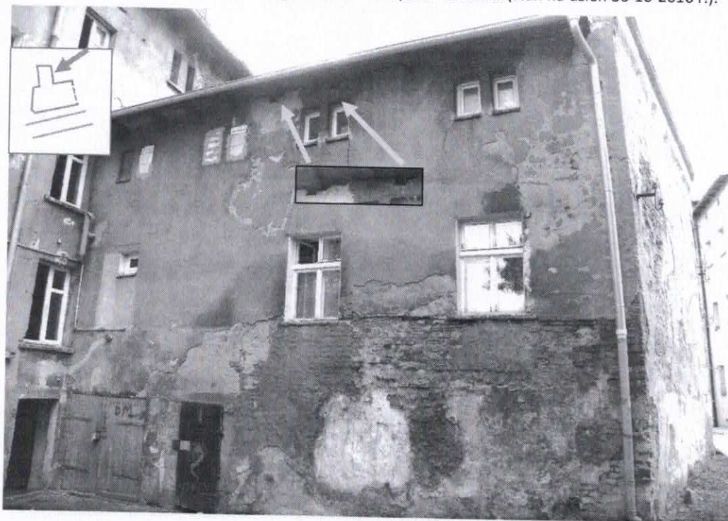
Fot. 4. Ściana wschodnia budynku przy ul. 1 Maja 110 w Wałbrzychu - ściana 4. Strzałkami szarymi zaznaczono miejsca przebywania gołębi miejskich (stan na dzień 30-10-2016 r.).