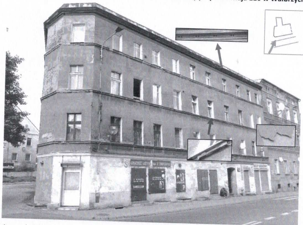
Fot. 1. Ściana południowa budynku przy ul. 1 Maja 110 w Wałbrzychu – ściana 1. Linia zieloną zaznaczono potencjalne miejsca gniazdowania jerzyków. Strzałką fioletową zaznaczono potencjalne schronienie nietoperzy. Strzałka niebieską zaznaczono potencjalne schronienie nietoperzy (stan na dzień 30-10-2016 r.).