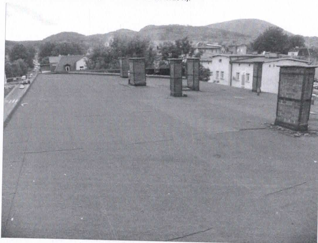
Fot. 6. Dach budynku przy ul. 1 Maja 110 w Wałbrzychu (stan na dzień 30-10-2016 r.).