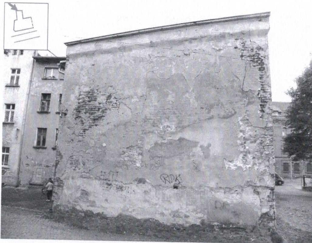
Fot. 3. Ściana północna budynku przy ul. 1 Maja 110 w Wałbrzychu - ściana 3 (stan na dzień 30-10-2016 r.).