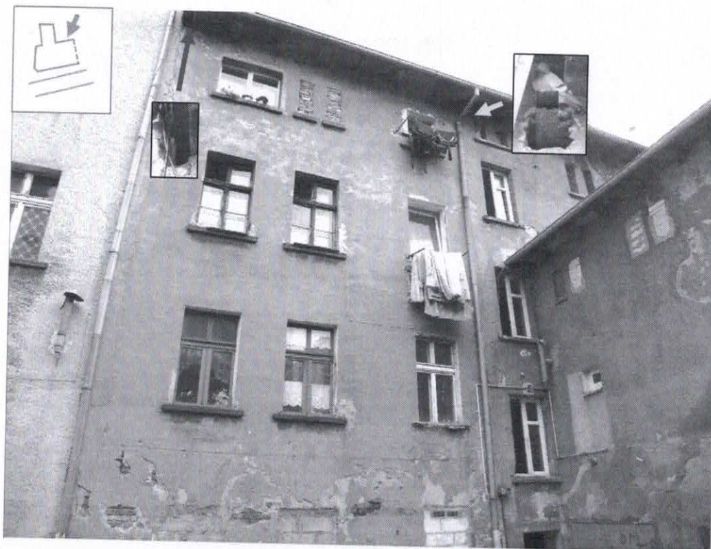
Fot. 5. Ściana północna budynku przy ul. 1 Maja 110 w Wałbrzychu - ściana 5. Strzałką fioletową zaznaczono potencjalne miejsce gniazdowania jerzyków oraz potencjalne schronienie nietoperzy. Strzałką szarą zaznaczono miejsce przebywania gołębi miejskich (stan na dzień 30-10-2016 r.).